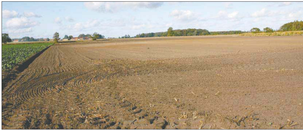
De største planteavlbrug kom dårligst ud af 2010 målt pr. hektar, mens de små planteavlbrug klarede sig bedst. (Arkivfoto)

Sammenlignes de største planteavlbrugs resultater med de næststørste, bliver for-